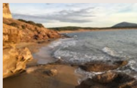
Douceur du soir

La primera observación es reconocer que no estamos «acabados». La segunda observación es admitir que es muy cómodo complacerse en la rutina y que esta rutina es el obstáculo que nos impide caminar hacia la autorrealización.