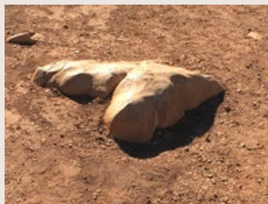
Une forme émergeant de sa gangue de terre...

Todos tenemos proyectos de vida y son tan singulares como cada uno de nosotros podemos serlo. La práctica del tai chi chuan tiene la peculiaridad de que puede ser una proyección de nuestros proyectos de vida: la experiencia demuestra que encontrar la fluidez en esta práctica, a solas y después a dos, es también encontrar la fluidez en nuestros proyectos de vida.